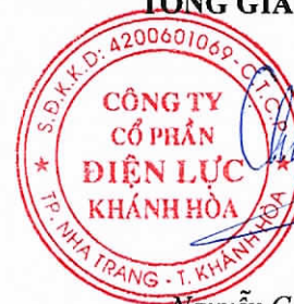
Nguyễn Cao Kỳ