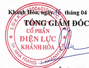
Nguyễn Cao Kỳ